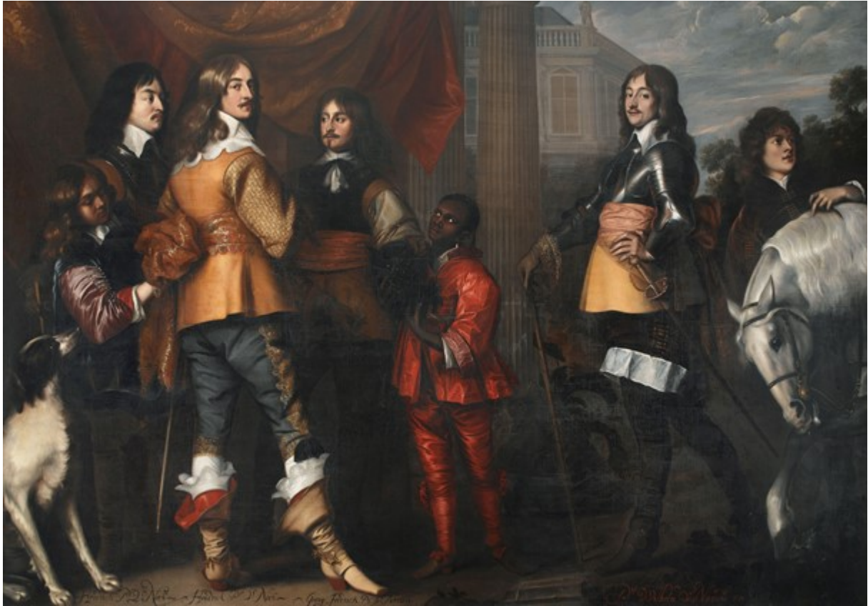
Schilderij in Nassauzaal van voormalig Stadhoudelijk Hof (Leeuwarden): Groepsportret van stadhouder Hendrik Casimir I, stadhouder Willem Frederik en Hendrik en George Frederik van Nassau Siegen Door Adriaen Hanneman (1604-1671)

1. Bekijk het schilderij en maak het onderstaande stappenplan.